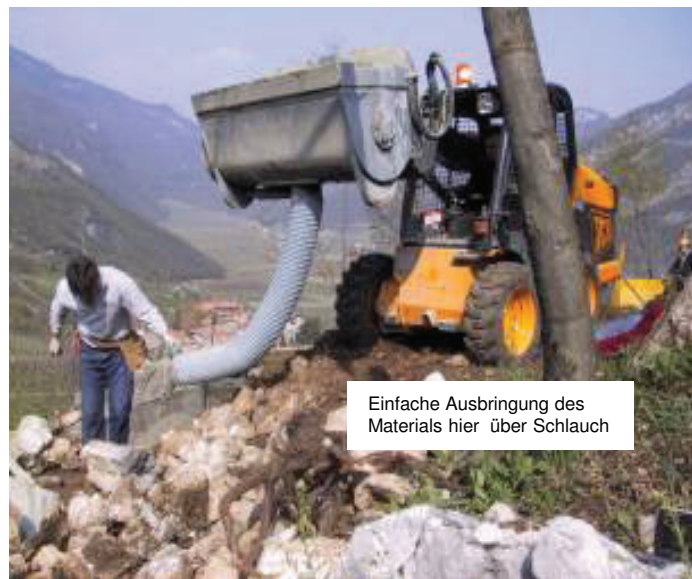
Einfache Ausbringung des Materials hier über Schlauch